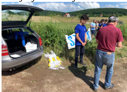
Start ARG takmičenja

Mišljenja smo da je ARG aktivnost uspešno realizovana u skladu sa planom aktivnosti kampa.