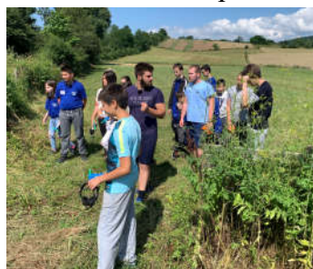
Priprema za start ARG takmičenja