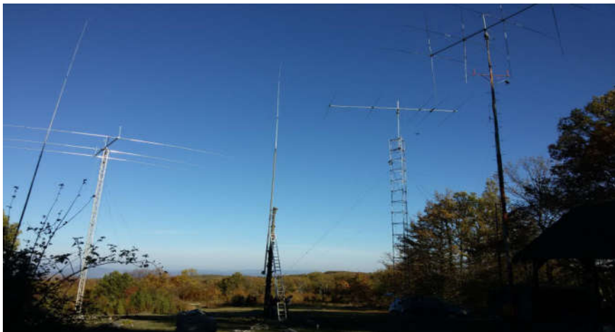
YT9X lokacija Košuta

Svim zainteresovanim polaznicima kampa omogućen je odlazak i korišćenje opreme na lokaciji YT9X, RK „Sevojno“. Sa dva radna mesta rađeno je sa pozivnim znakom YU0SRS i urađeno više od 1100 veza.