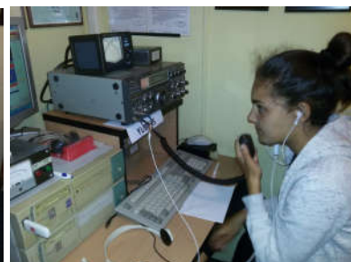
Marta u akciji