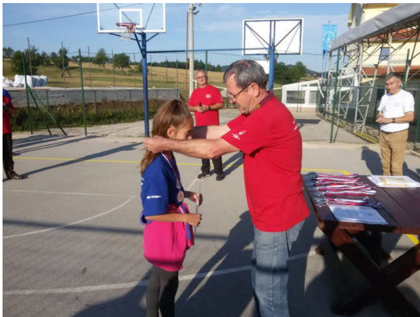
Uručenje priznanja - ARG