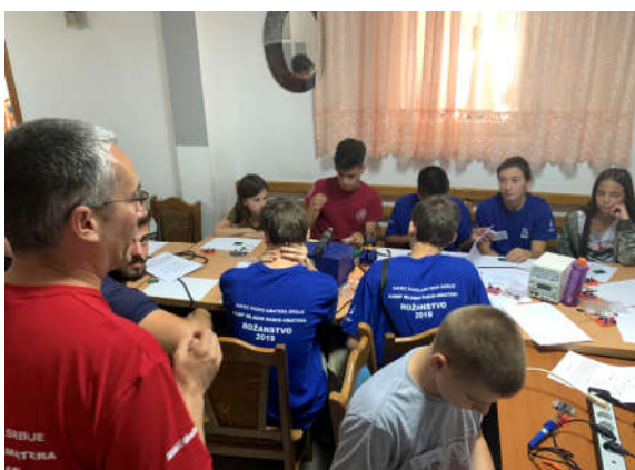
Sklapanje zujalice – početnici

Ističemo da su se, praktično svi, polaznici Kampa odazvali pozivu da donesu svoj alat tako da je lemilica i drugog alata bilo u izobilju.