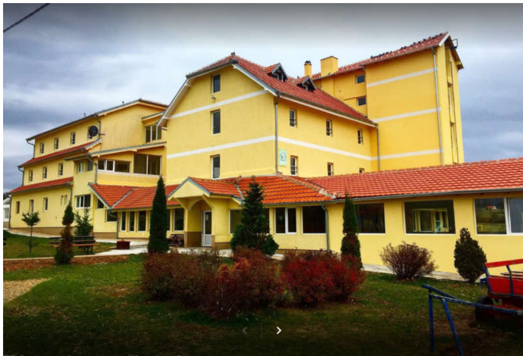
Objekat „Bela breza“

Pre slanja obrasca prijave za Kamp izvršen je izbor lokacije/objekta u kome bi se odvijale aktivnosti i odabrano je Dečije odmaralište „Bela Breza“ u mestu Rožanstvo, opština Čajetina.