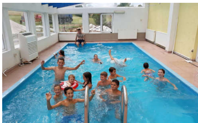
Osveženje u bazenu pod budnim okom „kontrolora“