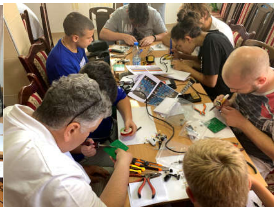
Sklapanje Arduino kita – napredna grupa

Zapažanje rukovodilaca konstruktorske sekcije sa predlozima je: