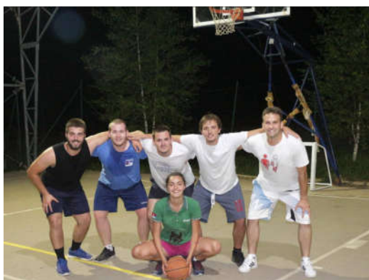
Uporni košarkaši sa lekarom odmarališta

Slobodnog vremena je bilo jako malo. Neki su bili spremni da planirani odmor posle ručka iskoriste za osveženje u bazenu odmarališta dok su drugi vreme od večere do odlaska na spavanje koristili na sportskim terenima odmarališta.