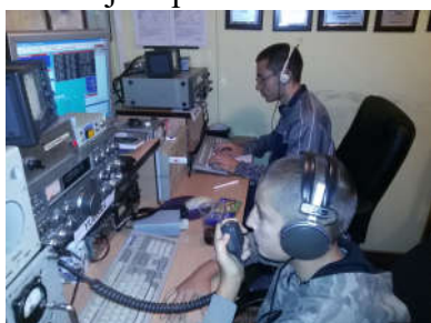
SSB i CW rad

Rad polaznika kampa na stanicama bio je pod stalnim nadzorom člana OO YU1ZZ i ostalih iskusnijih operatora.