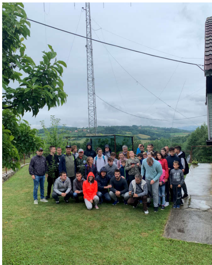
Na lokaciji YU1JW