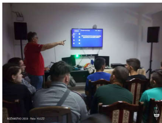
Igra može da počne