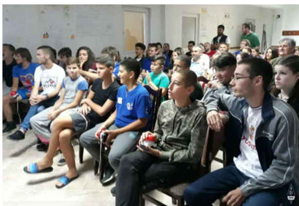
4 ekipe od po 4 člana

Tri prvoplasirane ekipe dobile su prigodne nagrade koje je obezbedio Vesimpex d.o.o.